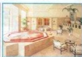
フィットネス・イオラ (有料)