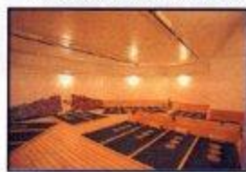
イオンセラピー・イオラ (有料)